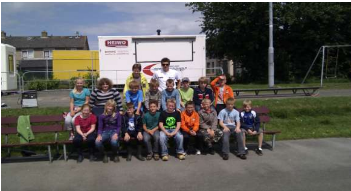
(, viscursus 2010, deelnemers gezamenlijk met Sven Kramer)

Dit jaar waren wij ook wederom vertegenwoordigd op de Friese Kampioenschappen, echter na twee jaren een kampioen, waren wij dit jaar niet succesvol.